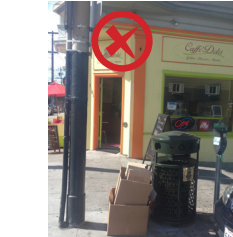
Неправильное выставление картона