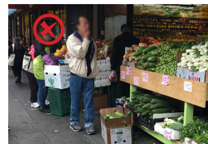
Неправильное размещение прилавков-витрин