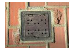
С люком на вентиляционном отверстии