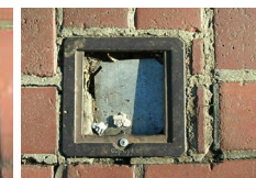
Без люка на вентиляционном отверстии