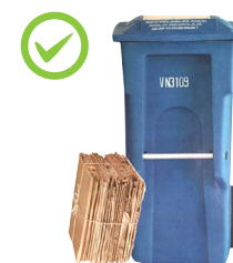
Правильное выставление картона