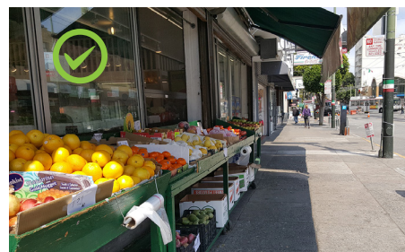
Правильное размещение прилавков-витрин