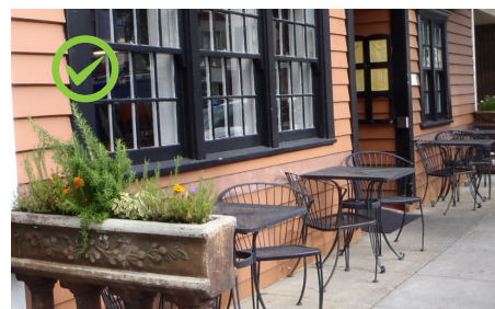
Правильное размещение столов или стульев