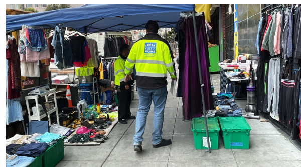
違規：阻礙行人所需通道