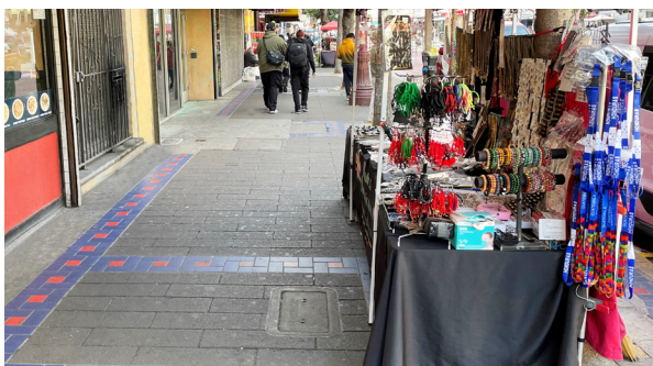
合規：保持 6 英尺筆直、暢通無阻的通道

符合條件的公共福利包括：CalWORKs, CalFresh, 一般援助, 加州醫療補助 (Medi-Cal), 補充保障收入 (SSI), 州補充支付計劃 (SSP), 加州婦嬰營養補充計劃 (WIC), 加州能源優惠計劃 (CARE) 或家庭電費援助計劃 (FERA)。