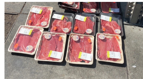
違規：銷售此法規或法令不允許的食品或飲料

如有任何疑問，請聯絡三藩市工務局： 電話：(628) 271-2000，或電子郵件： Streetvendorpermit@sfdpw.org 。