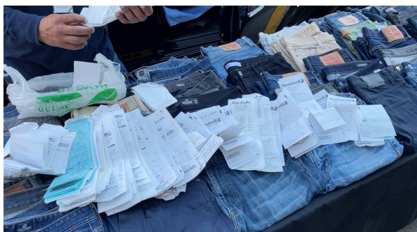
合規：所屬權證明隨時準備